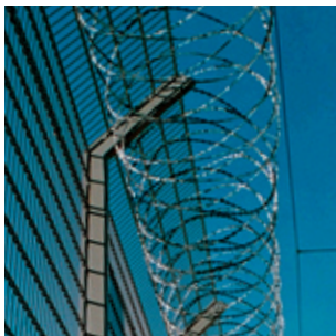
Oceľový drôt s čepielkami